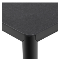
ANTRACITE MATERIA* vern. antracite 49552.02.352