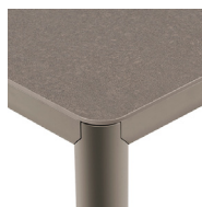
TORTORA MATERIA vern. tortora 49559.10.359

* Posizionare in zone d'ombra - Position in shaded areas - Placer dans des zones ombragées - In schattigen Bereichen aufstellen - Colocar en zonas de sombra