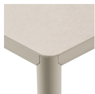
CORDA MATERIA vern. corda 49569.24.369

Material: tablero de laminado Materia HPL Solid Core. Estructura en aluminio pintado. Monta tacos regulables de goma y enganches planos de resina de polipropileno fiberglass. Tornillos de acero inoxidable A2. Efecto mate. Los componentes de aluminio, goma, resina y acero inoxidable son reciclables.