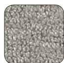
cenere Sunbrella® Terry 36253.00.132

PT Almofada Trill termoformada. Espessura 1,4 cm. Sem costuras. Com cliques de bloqueio. Enchimento: espuma de poliuretano com cobertura de membrana TPU impermeável. TEJIDO SUNBRELLA® TERRY: 76% fibra acrílica SUNBRELLA® tingida em massa e 24% poliéster. Resistência à luz 7/8. Lavável a 30°. Tratamento antimancha e antimoho.